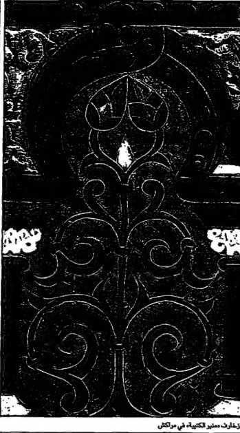
من زخارف منبر الكتبية، في مراكش

مراكش - قال مدير المتحف المغربي: «لا يزال من هذا المنبر من زخارف المتحف المغربي في مراكش... صنع في الاندلس وانتقل الى المغرب خلال القرن 12...»